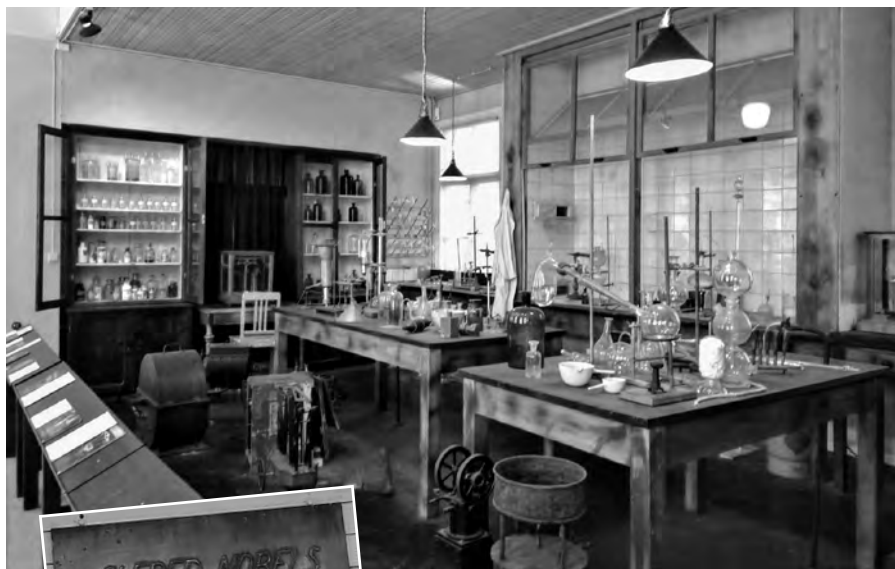
Alfred Nobels Laboratorium på Nobelmuseet i Karlskoga

sar bra som kemist i filmen. Båda sökte som statister till filmen och fick rollerna som kemister.