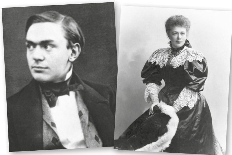
Alfred Nobel som ung och Berta von Suttner

I början av september var åter ett filmteam på Alfred Nobels Björkborn, Nobelmuseet i Karlskoga och spelade in en ny dramadokumentärfilm. Ett år sedan gjordes film om bröderna Nobels liv där många scener spelades in här på Nobelmuseet i Karlskoga. Den här gången handlar filmen om Alfred Nobel och hans förhållande med Bertha von Suttner och uppkomsten av Nobels Fredspris. Filmen spelas in både i Karlskoga och i Österrike där scenerna med Bertha von Suttner spelas in.